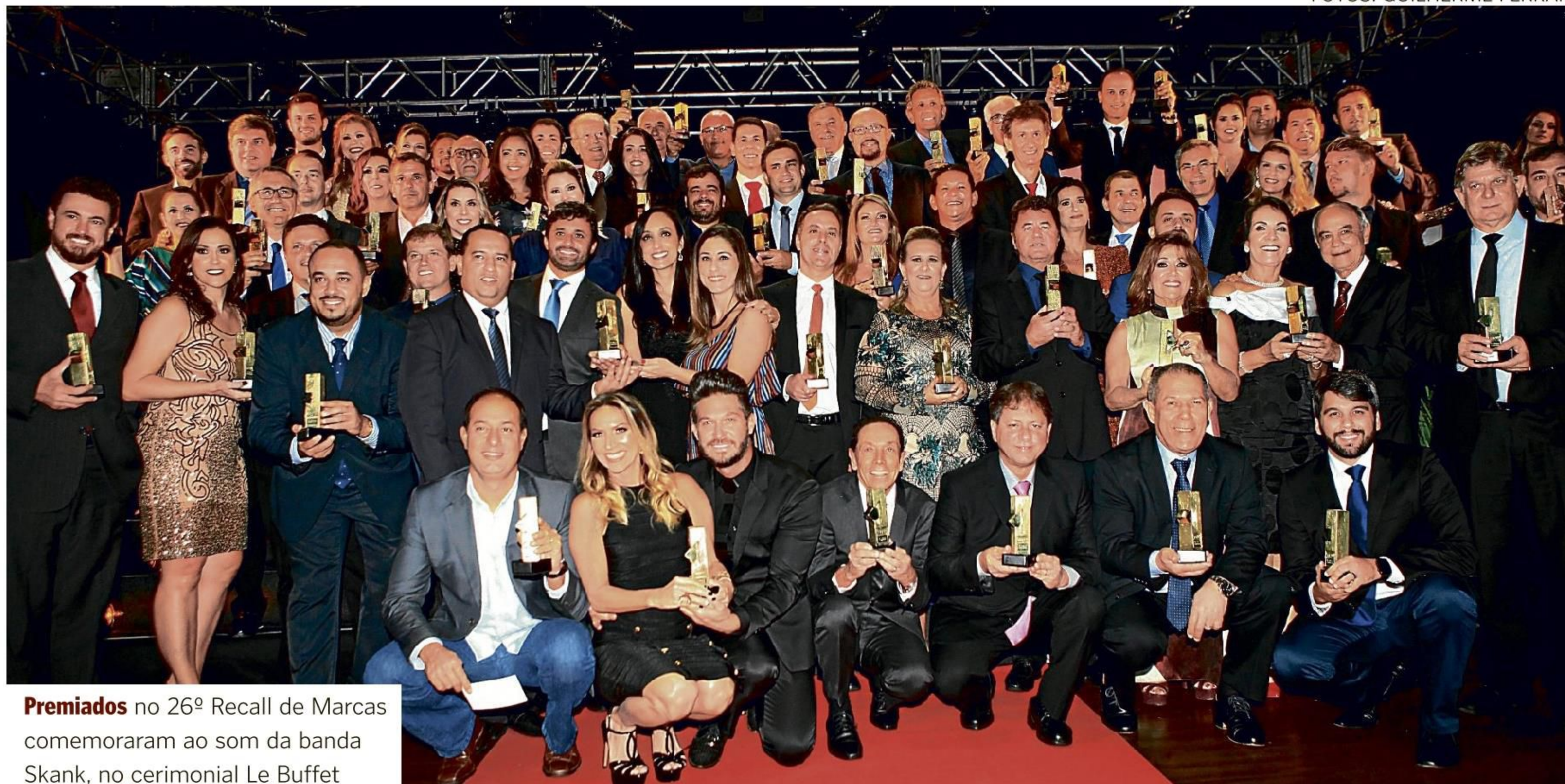
Premiados no 26º Recall de Marcas comemoraram ao som da banda Skank, no cerimonial Le Buffet