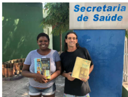
Assistidos do Caps AD aprovados no Ifes

Os principais objetivos são tratamento, reabilitação e reinserção social dos pacientes com transtornos mentais severos e persistentes decorrentes do uso de substâncias psicoativas.