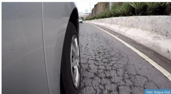
Descida da Ponte da Passagem, sentido Maruípe

A reportagem do Gazeta Online percorreu mais de 50km com uma câmera mostrando como está a situação do asfalto nas principais vias da Capital