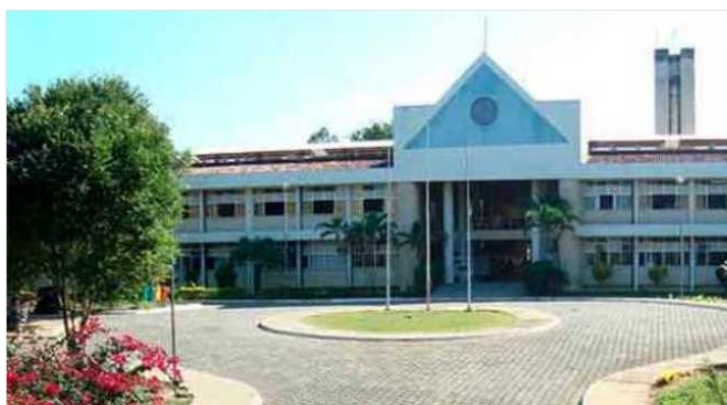
Folha Vitória Folha Vitória

O Campus do Ifes de Colatina vai realizar dois importantes cursos em parceria com a escola estadual Lions Clube no Bairro Moacyr Brottas.