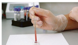
Amostra de Sangue é analisada em laboratório: pesquisa investiga as formas de transmissão da Covid-19 e sua disseminação no meio ambiente (Foto: Dayana Souza - 09/06/2020)

Por Francine Spinassé, do Jornal A Tribuna 09/07/2020 às 12:51