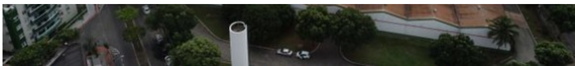
Galpões do Instituto Brasileiro do Café, o IBC, em Jardim da Penha.

A sessão pública para licitação será realizada no dia 12 de abril, às 15 horas. Será permitido o envio de propostas até as 14h59 da mesma data, “sendo este o prazo final para apresentação da documentação e das respectivas propostas para alienação do domínio pleno dos imóveis da União a seguir relacionados, nas condições em que se encontram, na modalidade de concorrência pela maior oferta, respeitado o preço mínimo a eles atribuído.”