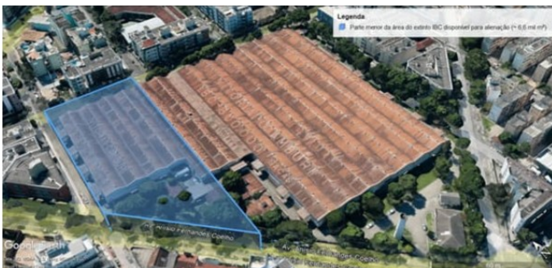
Mudanças nos galpões do IBC: área que será leiloada.

A publicação da desestatização ocorre após o Instituto Federal do Espírito Santo (Ifes) ter assumido a gestão, manutenção e segurança de parte do espaço, em agosto de 2021, com a intenção de implantar um polo tecnológico no local.