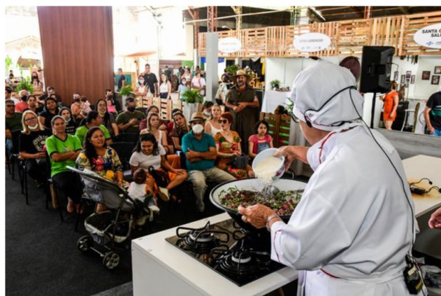
Cozinha Show terá 30 aulas gratuitas.

O espaço dos expositores será 40% maior em relação a 2021, ocupando três galpões e a parte externa do Polentão. Ao todo, garantirão presença 66 empreendimentos da agroindústria e do agroturismo, 20 de artesanato, dez de turismo de aventura; dez do Espaço Café, 15 do Espaço Flores; 15 para a praça de alimentação e 21 cervejarias.