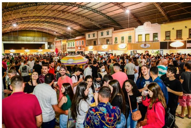
Feira contará com 157 expositores em quatro dias, no Polentão.